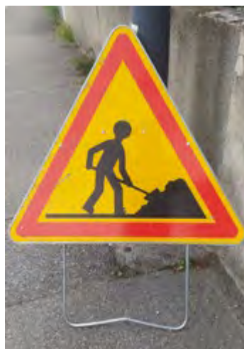
Le règlement de voirie a pour objet la coordination des travaux. Il relève du pouvoir de police de la circulation du maire.

La procédure de coordination des travaux, comme par exemple ici lors des travaux rue Ambroise Croizat, “a pour objet d’éviter des ouvertures successives et désordonnées des chantiers sur les voies publiques”. (art.18)